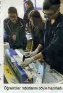
Öğrenciler robotlarını böyle hazırladı.